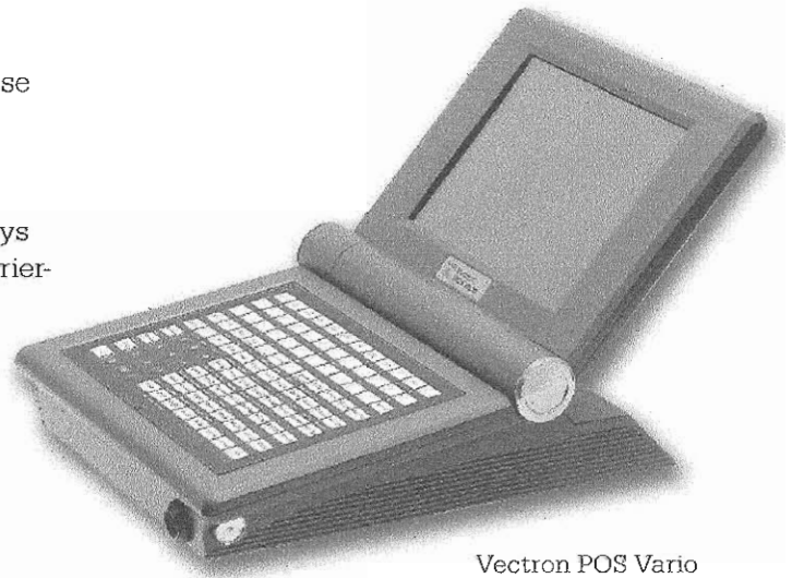
Vectron POS Vario mit Folientastatur