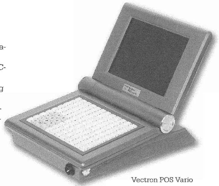
Vectron POS Vario mit Hubtastatur