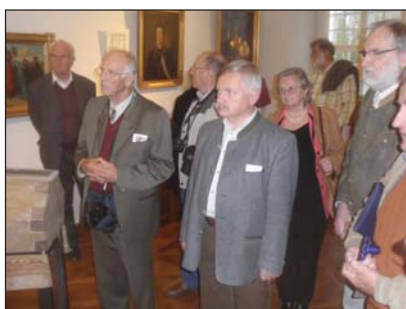
Heimatkundliche Tagung mit Sonderführung „900 Jahre Stift Herzogenburg“