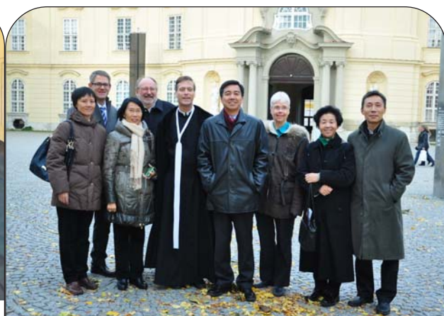
Ein Gruppenbild mit den hohen chinesischen Gästen beschloss einen erfolgreichen Sonntag