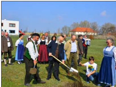
Elsbeerbaum-Pflanzungen u.a. im Schlosspark Vösendorf („Baum des Jahres“)